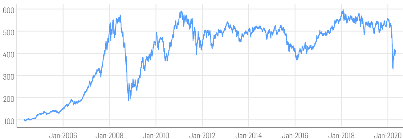
■ BNP Paribas Global Agribusiness Total Return Index (USD)